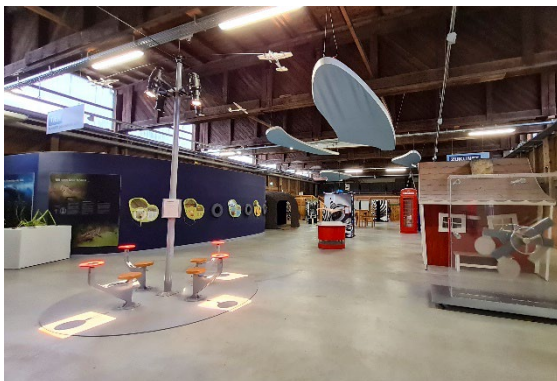
Blick in die Ausstellung „Wunder Wahrnehmung“ im Zoo Heidelberg.

Fotos: Impressionen aus der Ausstellung „Wunder Wahrnehmung“ im Zoo Heidelberg