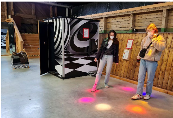
An der Lichtorgel lassen sich kleine Symphonien komponieren.