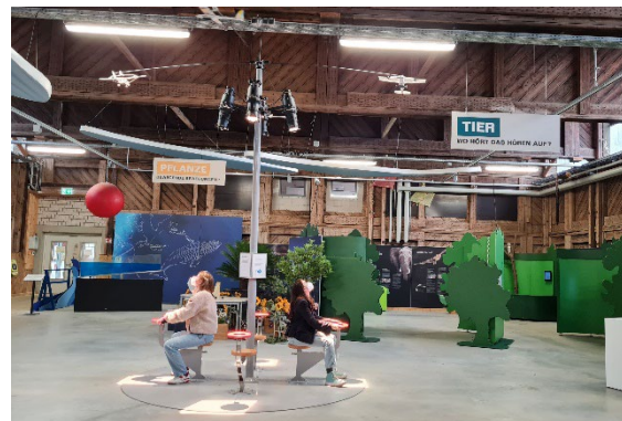
Mit Hilfe von Licht werden die Flugzeuge am Solarflieger angetrieben.