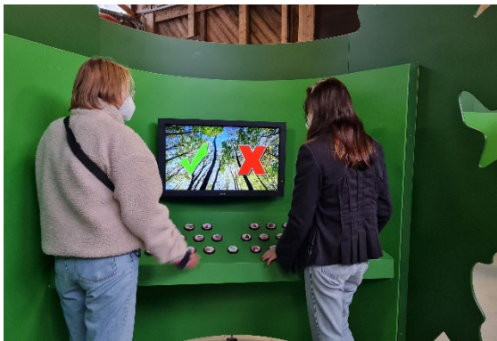
Wer kann die Tierstimmen beim Tierstimmen-Memory richtig zuordnen?