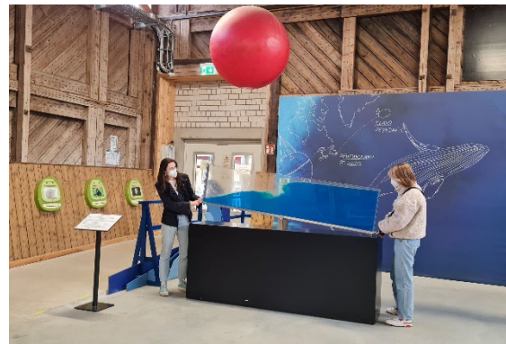
Wie ein Tsunami entsteht, zeigt dieses Exponat.